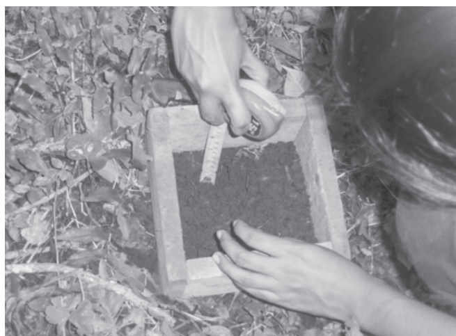
Figura 2. Cuadrado de madera de 15 cm de largo y 15 cm de ancho, y 15 cm de altura para la toma de la muestra de suelo.

El muestreo en cada sitio incluía cuatro capas sucesivas de suelo separadas, que fueron removidas con la ayuda de un cuchillo filoso y cuchara de jardín, luego la muestra de cada capa se colocó en bolsas plásticas, marcadas con el nombre del sitio, número de línea, número de parcela y capa para llevarlas al invernadero. Las muestras incluían la capa de litter y tres capas de suelo mineral sucesivas de tres centímetros de grosor (de 0-3 cms, de 3-6 cms y de 6-9 cms) (Teketay & Granström, 1995). El número de muestras de suelo fueron 48.