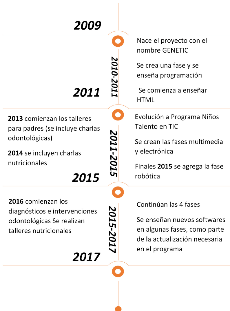
Figura 1. Línea del tiempo de la evolución del programa en el periodo 2009 al 2017.

Nota: Elaboración propia con la información obtenida de las entrevistas con ex decanos y ex coordinadores de carrera y revisión documental.