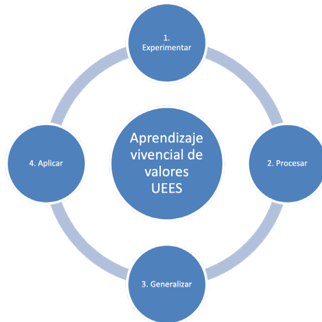
Fig. 3 Se muestra las fases del aprendizaje vivencial aplicadas al curso de valores. Fuente propia.