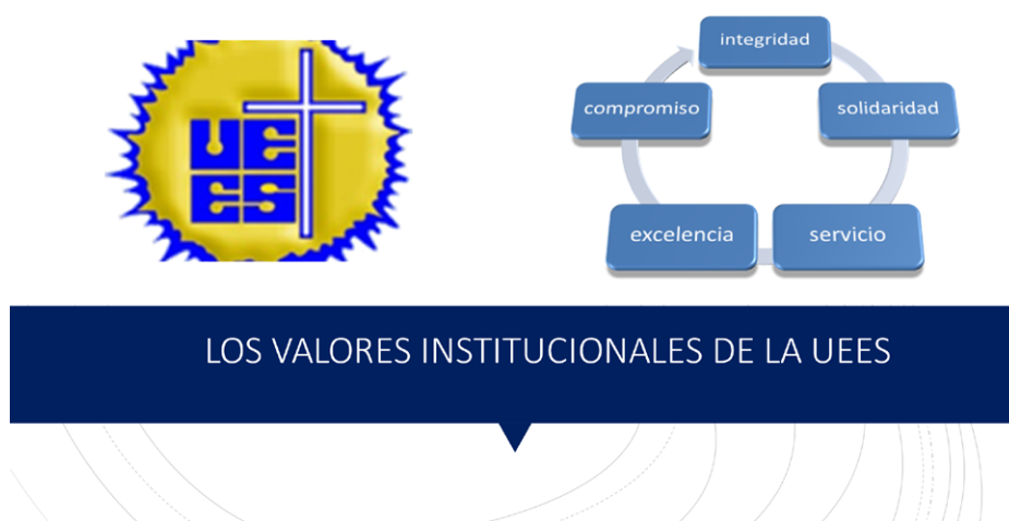
Fig. 1. Con los 5 valores UEES, construcción propia.

Los valores de la UEES se enuncian en la figura a continuación: