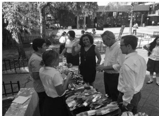
Figura n.º 3. Feria STEM organizada en junio 2017 por el Centro Escolar Concha Viuda de Escalón.

El proyecto ha tenido un efecto multiplicador. En junio del año 2017, los docentes del C.E. Concha Viuda de Escalón organizaron la primera feria STEM. Los estudiantes realizaron proyectos en las áreas de ciencias, matemáticas y artes estéticas (Figura n.º 3).