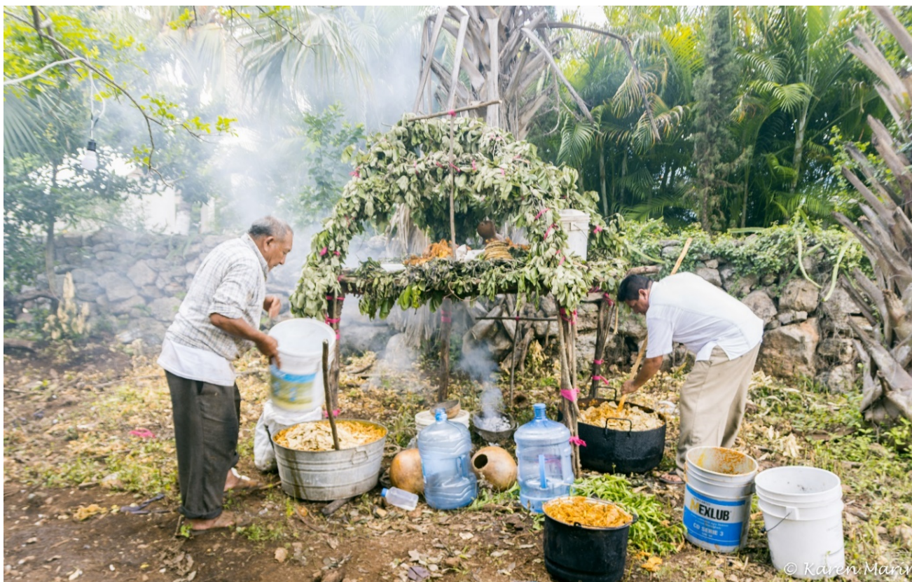
Figura 4: Ceremonia del Cha' Cháak, oficiada por el H'Meen y la comunidad. En ella, los números de ofrendas suelen ser de 13 por cada elemento y un total de 4 elementos dispuestos en cada punto cardinal, dando un total de 52, un número con alto valor simbólico en los calendarios sagrados mayas.

y Maní , donde a cada mes le corresponde un augurio rodeado de elementos de su naturaleza cercana, pero que también podemos apreciar la necesidad de mantener equilibrios entre los mismos, un principio común que hoy en día vemos en las terapias de los especialistas religiosos contemporáneos que sutilmente han incorporado desde numerales calendáricos como realizar 13 ofrendas en el centro de un altar, previamente orientado a cada punto cardinal.