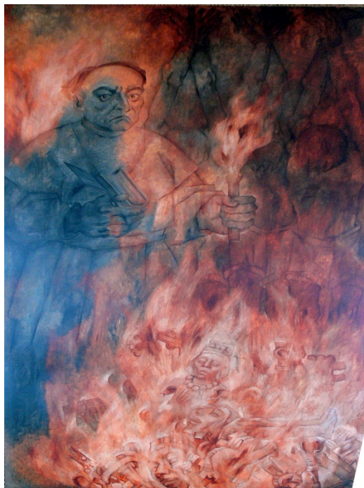
Figura 2: Fray Diego de Landa durante el “Auto de Fe” en Maní Yucatán. Pintura de Fernando Castro Pacheco.

cuando se narran aspectos relacionados con lo religioso, primeramente, por la influencia cristiana que se tiene en dichos documentos, debido a que, como ya se mencionó en el apartado anterior, muchos de los principales especialistas religiosos de alto rango fueron el blanco principal de las persecuciones, salvo el caso de algunos que decidieran someterse a los procesos de evangelización, ya sea por supervivencia o conveniencia (Ruz Sosa, 2002), los otros, de menor rango, dedicados a cultos de menor escala, tampoco estuvieron exentos de dichas influencias, independientemente de su labor anterior desarrollada en lo clandestino.