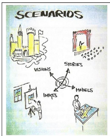
Figura 2. Estructura de los escenarios.

Estos escenarios, o base sobre los que se intentará crear esas hipotéticas imágenes de futuro, se han de materializar mediante algún proceso y técnica. Es decir, una vez establecidos los principios y desarrollado conceptualmente el escenario, es necesario simular la dinámica de ese fenómeno en el contexto establecido (figura 2).