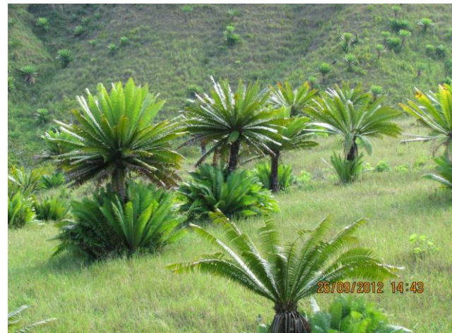
Figura 3. Plantas de teocinte ( Dioon mejiae ) en la comunidad del Saguay, Olancho, Honduras.

Saguay, donde observamos una alta concentración de individuos de esta especie (Figura 3). Esta planta es de gran utilidad ya que es comestible (Reyes y Suazo 2007). Sin embargo, su mayor valor está posiblemente en su potencial ecoturístico (Espinal y Mora 2012). También detectamos el guayabo de cerro ( Eugenia lempana ), el mestizo ( Eugenia coyolensis ) y la hierba Croton pendens . Estas especies endémicas de Honduras son elementos característicos del Bosque Seco Tropical e indicativas de las características biofísicas particulares de la conformación de este tipo de bosque (Holdridge 1962).