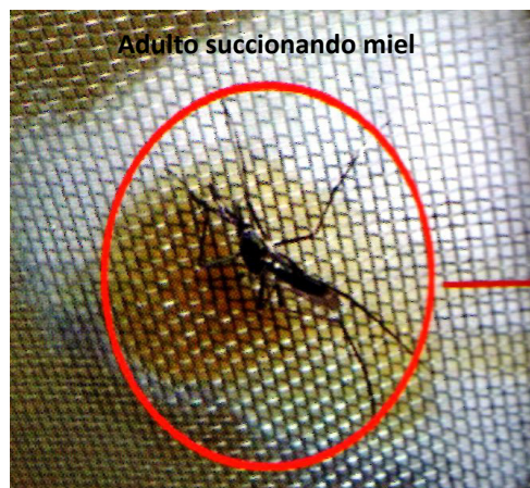
Figura 1. Macho de Toxorhynchites sp alimentándose de miel

Para una caracterización simple de los estadios larvarios 3 y 4, se observó y midió su tamaño; para lo cual, se colocaron en Cajas Petri sobre papel milimetrado, luego se depositaron las larvas y con una lupa, se procedió a contar el número de mm comprendidos en largo y ancho. Se midió así: la longitud que corresponde desde la parte posterior de la cabeza hasta la parte anterior de la cola (largo); para medir el ancho se midió la cabeza, aprovechando la rigidez de su exoesqueleto duro.