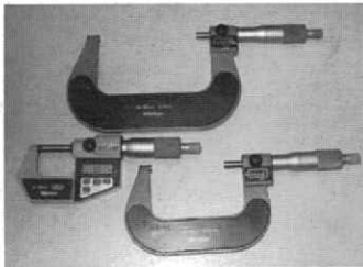
Figura 3. Micrometro.

Se tomaron las mediciones con micrómetro (fig. 3) para obtener medidas más exactas se realizaron en el área de ingeniería mecánica del ITCA las cuales se tomaron en 3 dimensiones VL, OC, MD para obtener mediciones más exactas de cada uno de los modelos, al modelo metálico se le realizaron muescas a nivel de las 3 dimensiones, llenando una ficha proporcionada por el grupo al operador.