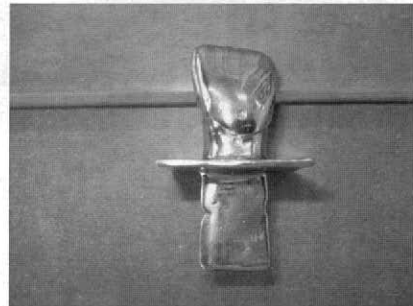
Figura 1. Modelo utilizado para impresiones.

Para llevar a cabo el estudio se confeccionó un modelo metálico (fig.1) en forma de incisivo con diámetros de Mesio distal de 15.77mm, Vestíbulo lingual de 11.96mm y cérvico oclusal de 18.64mm en aleación de cromo cobalto, tomando como modelo un incisivo central superior de yeso piedra con todas las características anatómicas de un diente natural, llevando una base de 3 cm. en el cual establecerá contacto con la cubeta individual, fabricada de 3 cm. de ancho por 3 cm. de largo y perforada para un mejor escurrimiento del material de impresión.