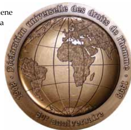
Medalla de la UNESCO 50 aniversario de los Derechos Humanos