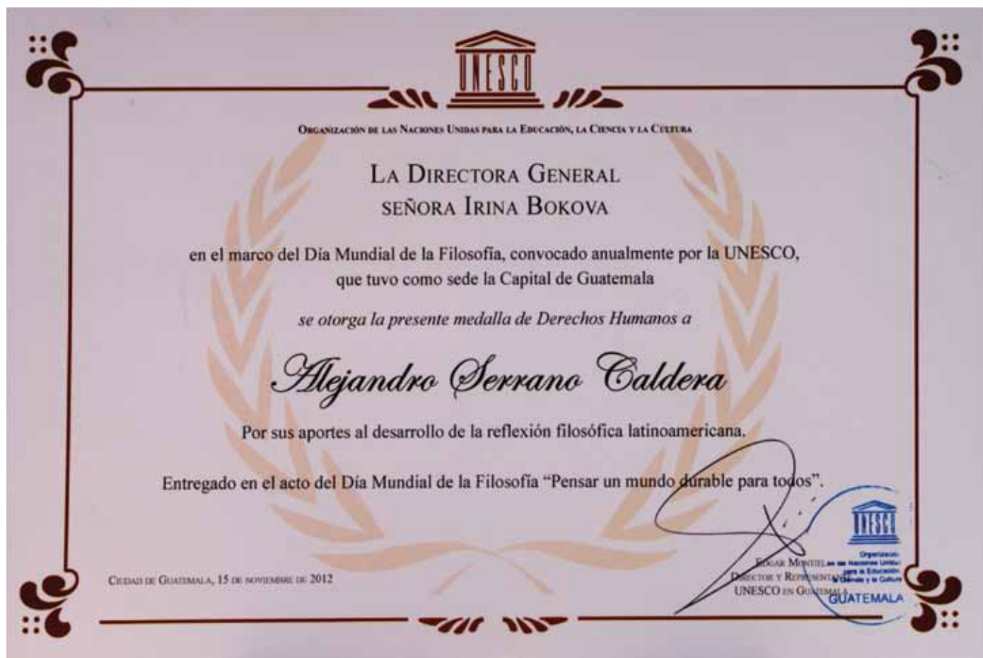
Diploma otorgado por la Directora General de UNESCO Irina Bokova en el día mundial de la Filosofía 2012 celebrado en Guatemala.

Se trata de preservar la identidad histórica y la pervivencia y acción recíproca de todas las culturas, la interculturalidad; de forjar un concepto de universalidad a través del diálogo de las culturas y de la Unidad en la Diversidad . Para ello hay que sustituir el juego de una sola imagen y de espejos múltiples por un concepto y una práctica de integración y retroalimentación de todas las historias y de todas las culturas.