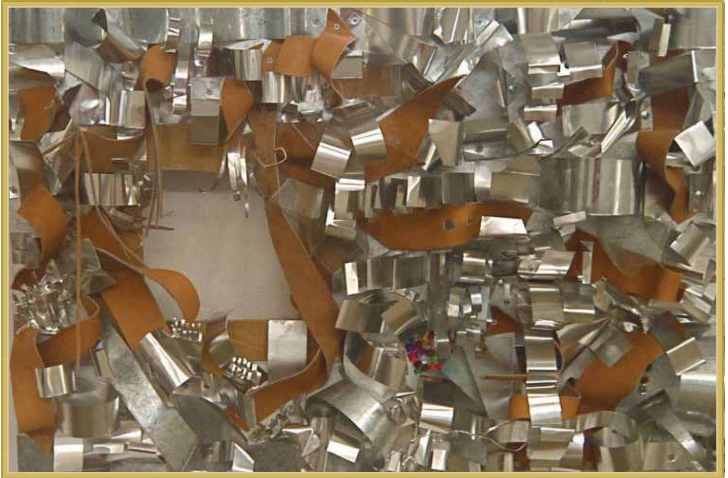
Técnica: Mixta, Año: 2012