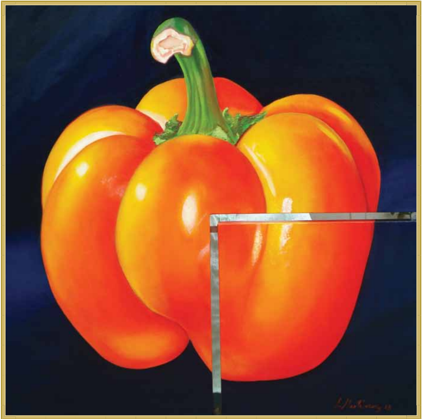
Título: "Chiltoma", Técnica: óleo sobre tela, Medidas: 100"x100" pulgadas, Año: 2010