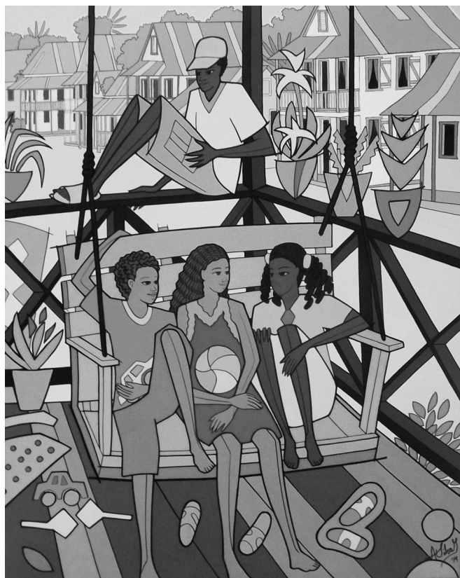
Autor: Augusto Silva. Niños en el Corredor . Acrílica sobre lienzo. 2014.

Incómodo está el negrito en Belén lo ven? lo ven? incómodo está el muzuquito entra la mula y el buey lo ven? lo ven? los magos anda perdidos y no llegan a Belén pastores pastores andan perdidos también.