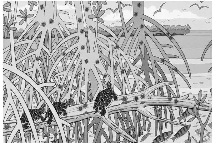
Autor: Augusto Silva. Tortugas . Acrílica sobre lienzo. 2016.

La guardia loandabuscando porque no nació en Judá venid y vedlo ahora preso muertodehambre está.