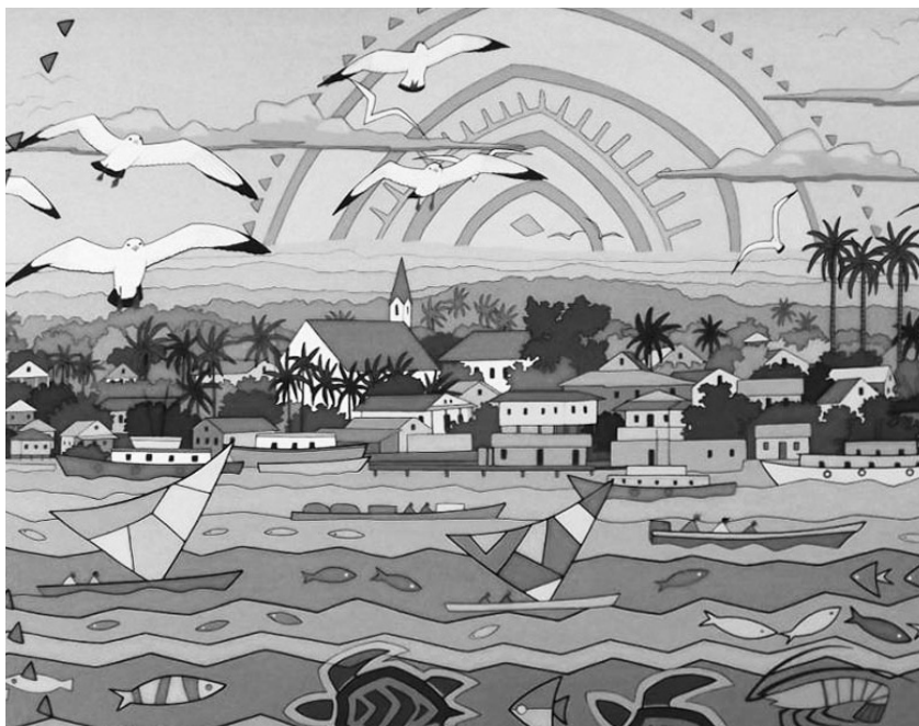
Autor: Augusto Silva. Título: Bahía de Bluefields . Acrílica sobre lienzo. 2016.

se en el espíritu del pueblo. Palo, quijada, trombón y tambor pueden dar el son de lo que quiere cantar y bailar.