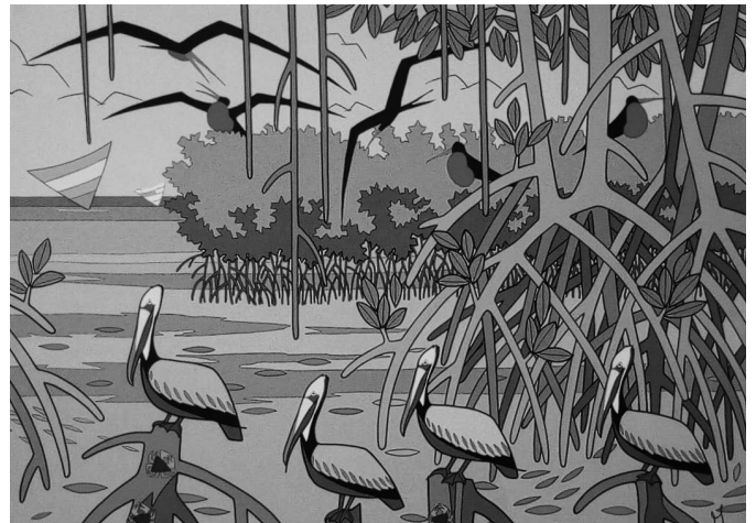
Autor: Augusto Silva. Pelicanos posados . Acrilica sobre lienzo. 2019.

Te estaba esperando. Fuiste acomodándote en mis ojos lentamente, buey manso ganso y sin embargo nunca advertí la intimidad que con usura ibas ajustando. La cita del sábado, primero; después todos los días de la semana, todas las tardes a la misma hora los mismos lugares. Después mañana y tarde, café, almuerzo y cena. Ahora te enredaste en la fría posibilidad de mi sueño y en todo lo que pueda decirse en palabras familiares, en palabras rebuscadas en silencios atrapada, entrampada me atrapaste tramposa reflexiva, (por no decirte otra cosa).