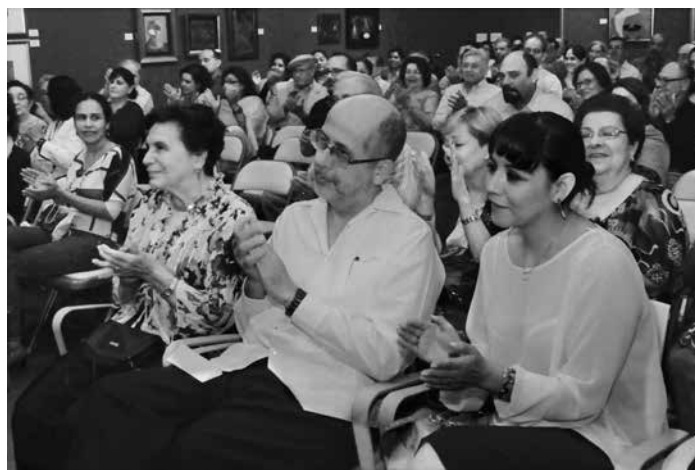
Público asistente al acto de presentación del Libro Valoración Múltiple, el 25 de abril de 2013 en el INCH.