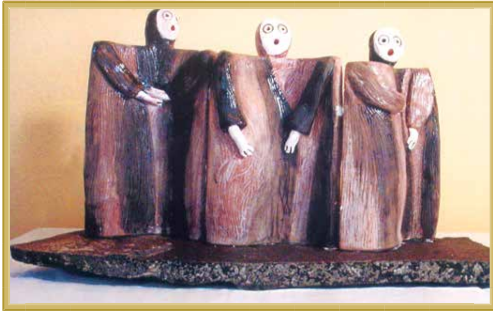
Título: "Homenaje a Las Meninas", Técnica: Cerámica montada en pies de hierro y base de mármol verde., Medidas: 18" alto x 22" largo.