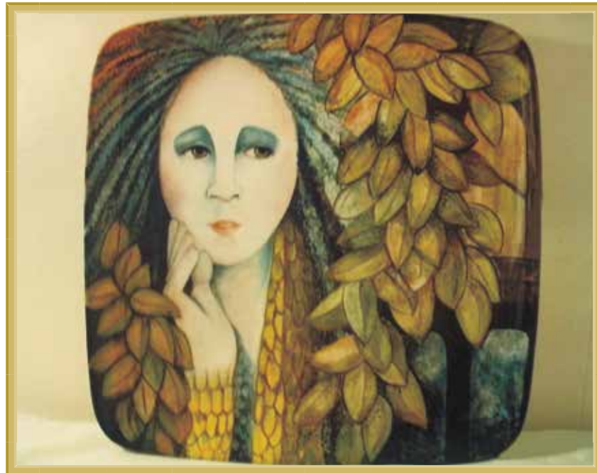
Título: "Ama de los bosques", Técnica: Platón de cerámica glaseada, Medidas: 18" x 18"