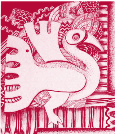
Autor: Rina Rodríguez Salamanca

Y es aquí con estos fundamentos en los contenidos de estos trascendentales documentos que se despliega nuestro análisis.