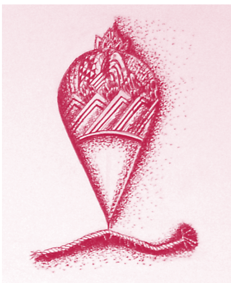
Autor: Rina Rodríguez Salamanca

Para echar estas bases es indispensable concebir la educación como la herramienta fundamental en la tarea constante de la edificación de esta nueva cultura de la paz. Cada una de estas bases, temas o áreas de acción, implica un tipo de educación que conforma el conjunto de conocimientos, prácticas, valores, competencias y habilidades necesarias para la construcción de una cultura de paz global.