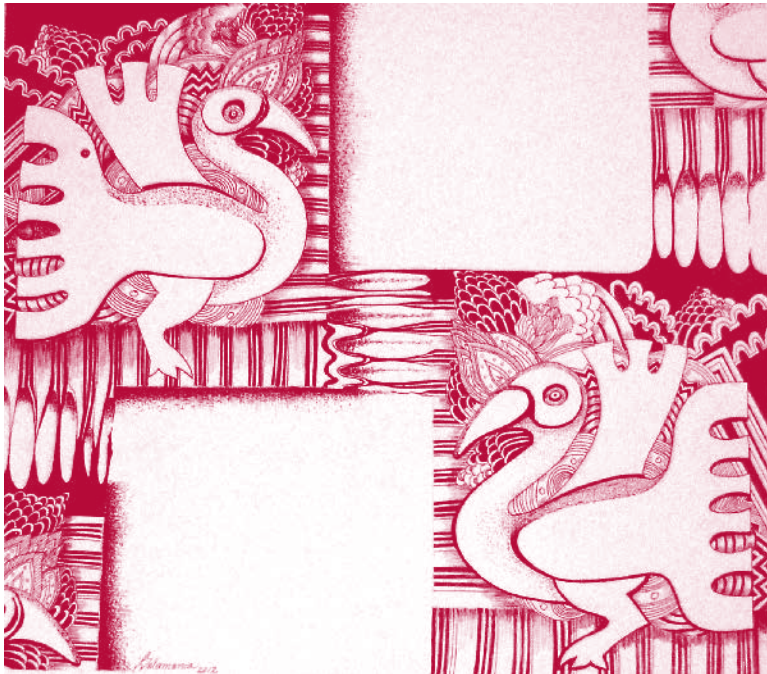
Autor: Rina Rodríguez Salamanca

Importante es reconocer que ya en 1986 el jesuita Felipe Mac Gregor Rolino aplicaba este concepto que llenó de significación con su práctica en la solución del problema de la violencia en el