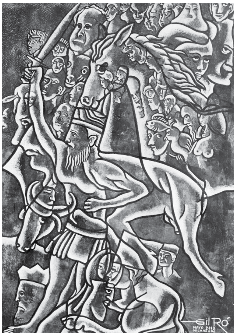
Autor: GilRo, Título: Mitología. 32 x 27 pulgadas

Recibido: 23 de agosto / Aprobado: 21 de octubre, 2013