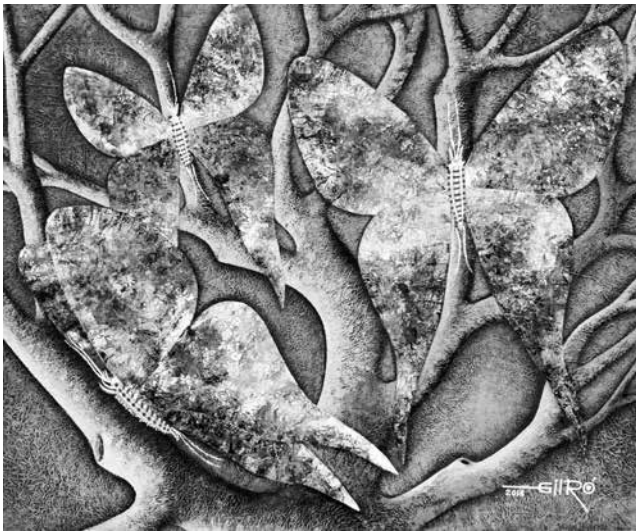
Autor: GilRo, Título: "Mariposa". 28x34 pulgadas

El abordaje de un tema de relativa complejidad, como es "El Esencialismo Y La Esencialidad Del Arte" nos podría llevar al campo de la abstracción crítica y podría exceder el margen de tolerancia establecido por el estado de cosas y los convencionalismos del pacto social, que hasta el momento han logrado mantener a flote el entendimiento y la interacción entre las partes; es por eso que después de valorar la seriedad de un tema tan sensible debemos afrontar las posibles reacciones, ya presiento que no será tan fácil explicar de manera simplificada los asuntos metafísicos de la estética o viceversa; que en sí es el eje fundamental de esta tesis, propuesta particular que se arraiga dentro de otro contexto de mayor amplitud pragmática y especialmente filosófica como es el arte.