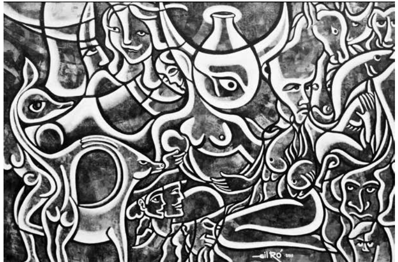
Autor: GilRo, Título: "Serie Mitológica". 3.2 mts x1.8 cms

¿Acaso un verdadero artista pintor puede renunciar a su paleta, a su pincel y a su lienzo, al delicioso