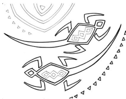
Autor: Augusto Silva