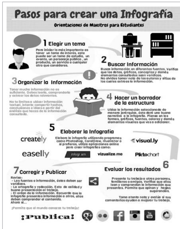
Figura 5 y 6.

Dos ejemplos como resultado de dicha actividad: