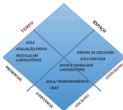
Figura 1. Atividades educacionais flexíveis

No planejamento de um curso a distância, a partir de um profundo conhecimento do perfil e das necessidades do público-alvo, bem como da clara definição dos objetivos de aprendizagem a serem alcançados, são definidos os conteúdos a serem abordados, os recursos tecnológicos a serem utilizados e as propostas metodológicas a serem desenvolvidas.