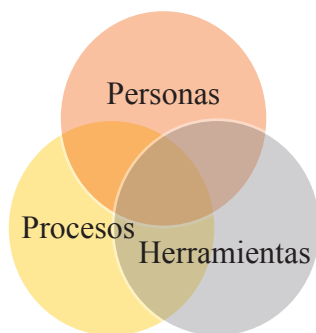
Figura 3. Elementos de excelencia del negocio

Hasta ahora, hemos visto cómo los procesos afectan directamente las operaciones de una empresa, pero ¿qué sucede con las personas? ...Palmatier (2002) plantea que los elementos de excelencia en un negocio son: las personas, las herramientas y los procesos, que no pueden estar separados unos de los otros sino conectados entre sí, tal como se representa en la siguiente figura.