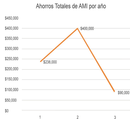
Figura 2. Ahorros netos anuales por mantener activo el programa AMI.

Una de las principales concesiones que trajo consigo uno de los máximos beneficios se debió a un contrato con uno de los principales proveedores de partes aeronáuticas en el mundo y, por ende, su principal distribuidor. Dicha negociación dio origen a lo que se estableció como Servicio de Reposición Automatizado, o por sus siglas en inglés, AMI ( Aircraft Managed Inventory ) destinado a mantener el inventario de la compañía en el nivel predefinido acordado para cada parte, bajo ciertas condiciones.