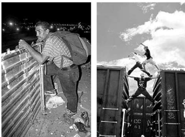
Ilustración 2. Septiembre de 2004.

El éxodo es salida, marcha, emigración de una comunidad o un grupo de personas, explica el Diccionario de la Lengua Española (RAE, 2005). En la muestra, la prensa escrita ha presentado este éxodo con un cierto carácter religioso de ese pueblo que marcha hacia la tierra prometida. Una de las grandes preocupaciones sobre el tema de la migración pasa por la crónica del difícil trayecto que siguen los migrantes. En esta temática, el relato de la prensa escrita retoma un estilo dramático, una narrativa donde el héroe o la heroína 8 se enfrentará a su destino y podrá evadirlo. Contradictoria. Difícil. Dura. Inacabada. La narración es la historia de aquel que se aventura en la ardua prueba. Si logra sortear todos los obstáculos obtendrá la recompensa de la “tierra prometida” (EDH, 02/05/05). Pero para alcanzar su objeto de deseo, nuestro héroe o nuestra heroína deberá enfrentarse a los malvados intereses de los coyotes, derrotar el hambre, el abrasante calor del desierto, la implacable “migra” y los recientes patrulleros.