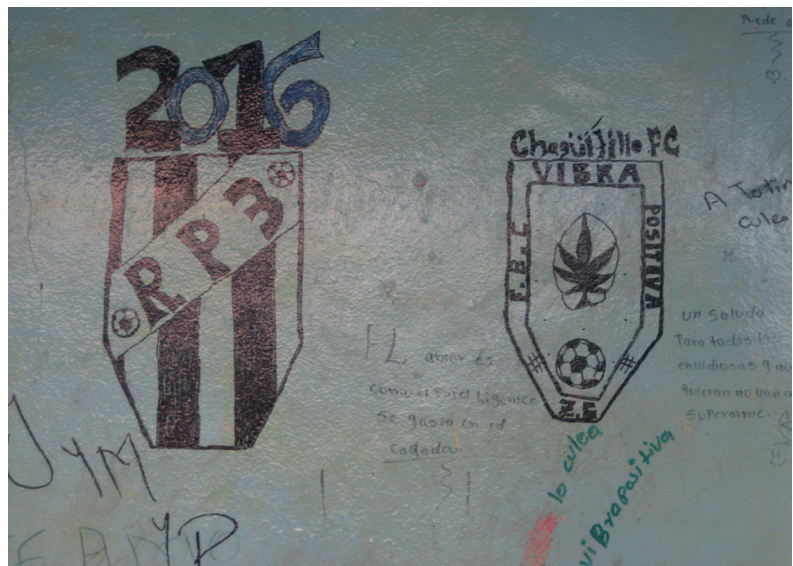
presentación de dos escudos de equipos de futbol sala de la comunidad, una representación de la identidad, en la Cancha de villa Chagüitillo

La experiencia del habitar se conforma a partir de raíces y rutas, en este sentido el espacio se experimenta y significa tanto en las relaciones fijas, residenciales, como en los viajes que se realizan, cotidianos, reales o imaginarios. (Clifford, 1997), y en el caso de Villa Chagüitillo la relación de cómo algunos actores sociales trasladan su lugar de origen como es el barrio hacia el espacio social más importante en la comunidad “La Cancha” un escenario multiuso.