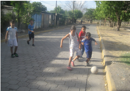
Jóvenes de Chagüitillo jugando al fútbol en la calle

(2015) a la evidencia empírica como tal, como ejemplo temporal se presenta los juegos de fútbol iniciados por los jóvenes de Chagüitillo en sus calles. Ese tipo de acciones de interacción, ayudan en los procesos de producción de felicidad de los participantes, facilitando un desarrollo humano más integral, practicando actividades que promueven la salud e incursionando en sus habilidades de socialización.