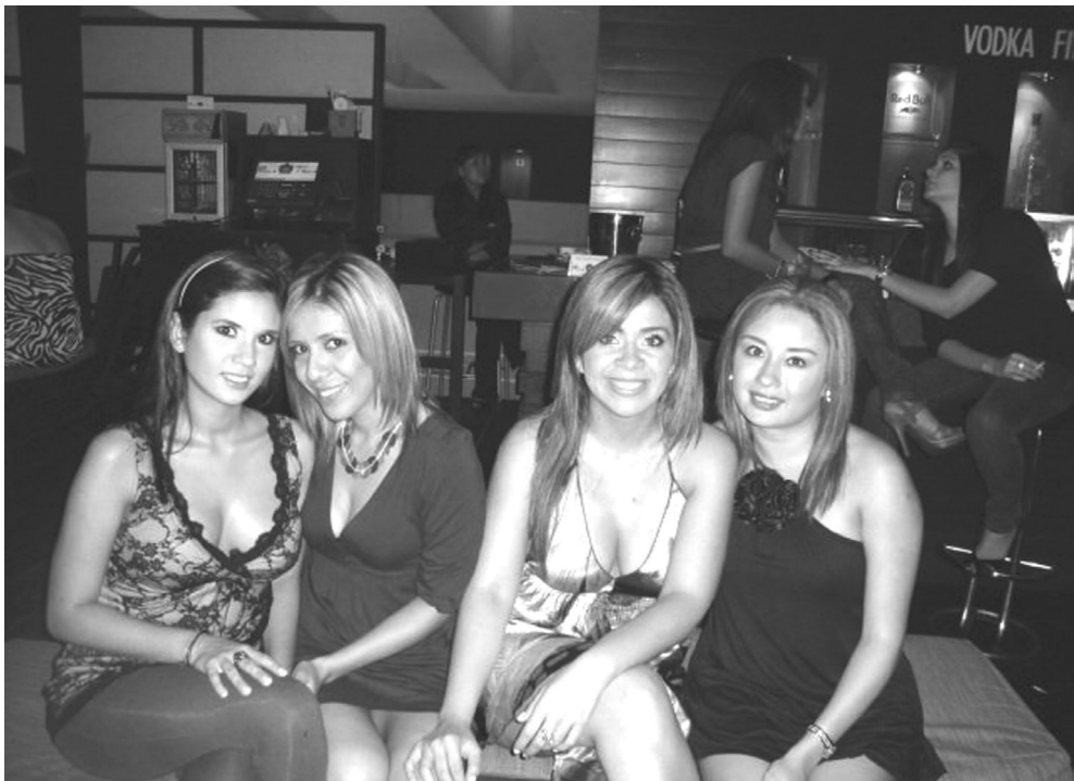
En la sociedad salvadoreña, exhibirse a través de la forma de vestir es un medio para destacar partes del cuerpo que se califican como “deseables” y que son importantes para los rituales de cortejo.

Si el vestir es una invitación al diálogo, es más precisamente al diálogo que se busca. Por lo tanto, existen estrategias a través del vestido como medio expresivo para competir con éxito en el mundo de la seducción. En la socie-