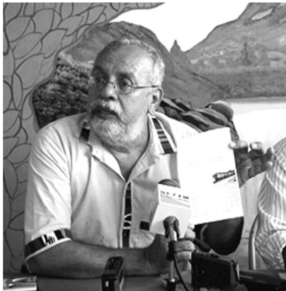
Estas personas expresan por medio de su estilo de vestir su oficio de artista, intelectual y humanista.

Estas personas expresan, a través de la totalidad de su vestir o con algún aditamento o accesorio en su cuerpo, su oficio de artista, intelectual, humanista o miembro de una ONG, universidad o simplemente su pretensión de serlo. Este estilo en el vestir representa una posición antisistema, no en cuanto a una posición política, sino más bien en contra de un sistema tradicional de usos y costumbres, que en opinión de muchos tiende a uniformizar a la sociedad, negando las diferencias que, en un mundo globalizado, se acentúan y persisten, que no pueden