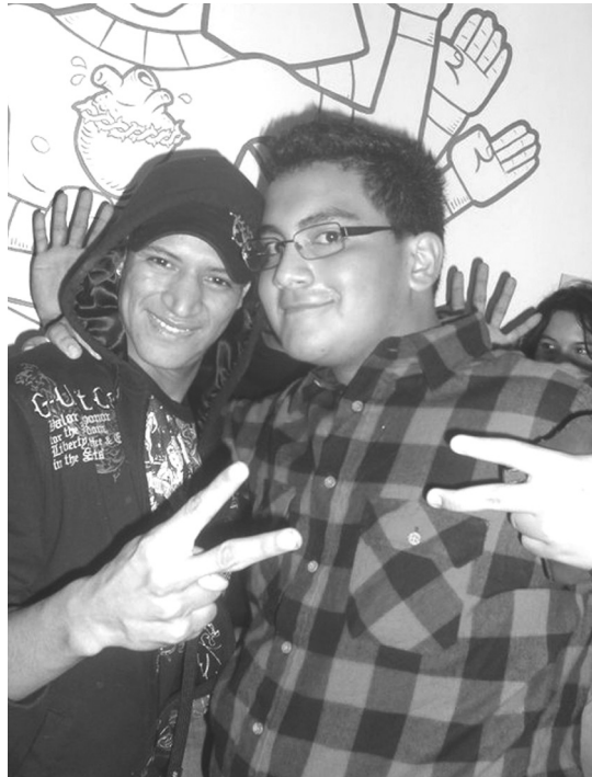
Este estilo es un reflejo de la importación de modas, basado en un género de música: el reguetón.

El reguetón , versión latina del hip hop (como estilo de vestir) tiene dos connotaciones: a) en su estado puro refleja el éxito material al que pueden acceder las clases marginadas. Sin importar cómo, se hacen acreedores del éxito económico y ostentan al máximo estos símbolos. Joyas, autos, licor y mujeres son sus aspiraciones. Su filosofía de vida consiste en gastar la mayor cantidad de dinero en una noche. Su lema: “El dinero nos hace iguales”; b) en su estado “salvadoreño” es producto de la asimilación cultural que el “hermano lejano” hace del estilo más marginal de la sociedad estadounidense, y que “remesa” (envía) esa tendencia a sus compatriotas.