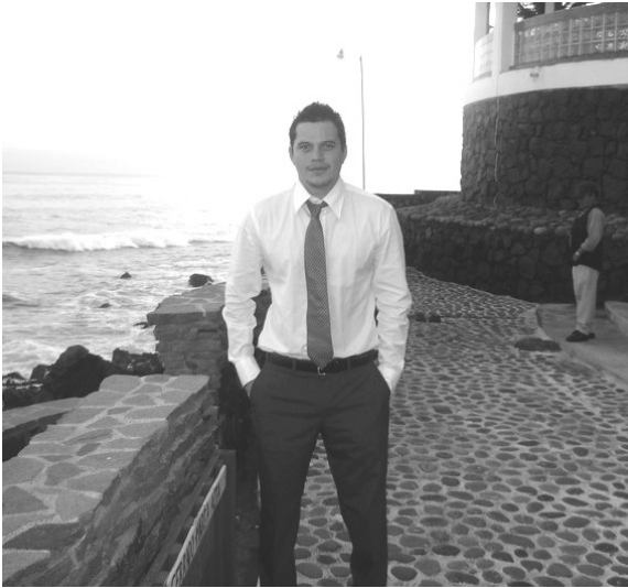
Los yuppies mantienen la tendencia de mostrar la imagen de éxito a través de su vestimenta.

asiduidad a restaurantes exclusivos, clubes, etc.; consumo de cuanto artículo el mercado pone a su disposición y adhesión a las modas no solo en el vestir, sino también culturales, etc.