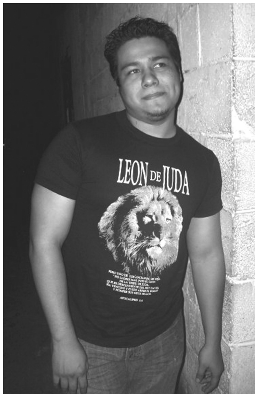
Las religiones han hecho de la comercialización de camisetas una insignia de sus adeptos.

Por su parte las iglesias pentecostales han hecho lo propio: camisetas que identifican a los miembros del “Castillo el Rey”, “Iglesia Peniel”, “Hombre de Cristo”, “León de Judá”, que se comercializan en diferentes locales, tanto de Plaza Mundo como del Centro de San