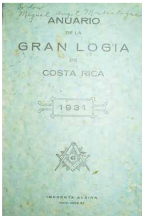
Imagen 1. Anuario de la Gran Logia de Costa Rica de 1931

Entre las obras que circulaban por América Latina y que posiblemente usaban los miembros de la Gran Logia se encuentran: Manual de Masonería o sea El Tejador de los Ritos Antiguo Escocés, Francés y de Adopción de Andrés Cassard (1861), El simbolismo de la masonería y ritual masónico de Albert Gallatin Mackey (1877), Esoterika. El Simbolismo de los Grados Azules de la Masonería de Albert Pike (1888), El libro del aprendiz. Manual de Instrucción Iniciática para el uso de los Francmasones del Primer Grado de Oswald Wirth (1894) y Moral y dogma del Rito Escocés Antiguo y Aceptado de Albert Pike (1944), entre otros. También leían la revista oficial de la Gran Logia Acacia, sus Anuarios y la Gaceta Masónica.