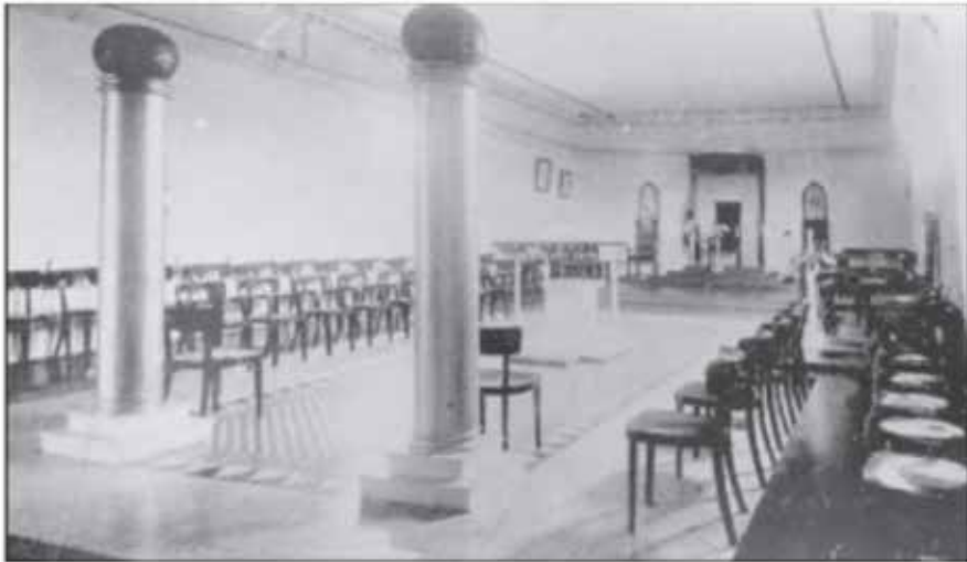
Imagen 2. Vista de la sala principal del Templo Masónico de la Gran Logia de Costa Rica, en San José en 1937