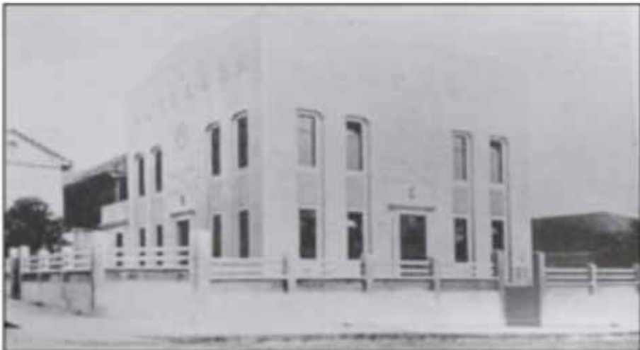
Imagen 3. Templo de la Gran Logia de Costa Rica en 1937