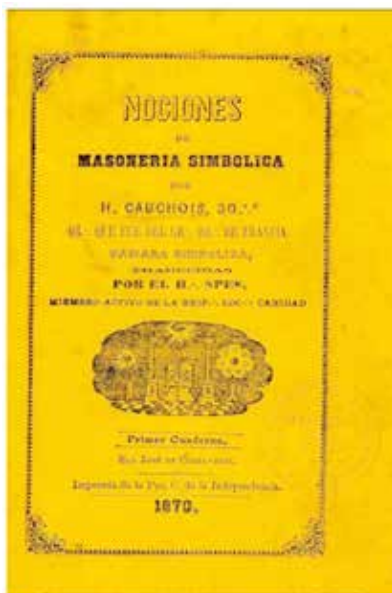
Imagen 4. Portada de Nociones de masonería simbólica de H. Cauchois