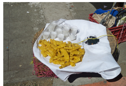
Figuras 3 y 4. Milagritos colgados en la imagen de la Virgen María y exvotos de cera a la venta en las afueras de la iglesias. Fotografía: Academia Salvadoreña de la Historia.2012.