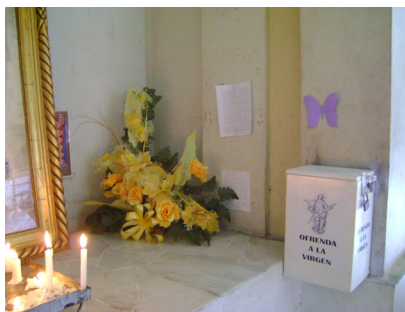
Figuras 5 y 6. Objetos personales como medallas, camándulas y ramos son ofrecidos a los santos como pagos o peticiones por el milagro recibido. 2011.

c) Discursivos . Son los objetos en los que se alude al milagro de manera escrita o gráfica en una base de papel, mármol, plástico o resina.