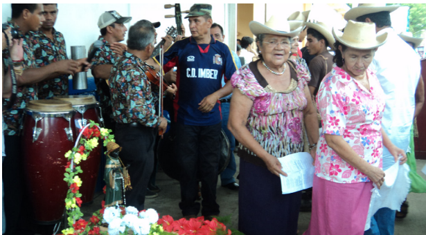
Danza de los Tabales se realiza por petición por la buena cosecha y como agradecimiento por los milagros recibidos y ofrendas de palabra a San Benito de Palermo. Ereguayquín. 2012.

d) Festivos . Estos son los exvotos relacionados con danzas u ofrendas de palabra como pago por los favores recibidos. Claros ejemplos de ellos se ubican en la zona oriental, donde se realizan danzas en agradecimiento por salud, bienestar económico, viajes migratorios, lluvias y abundancia de las cosechas. Para último este caso, la Danza de los Tabales realizada a san Benito de Palermo, personaje que con el tiempo llegó a ser un icono del mulato campesino de la zona oriental del país, en la que los que obtienen el milagro de las lluvias y las cosechas están comprometidos a bailar al menos una vez al año esa danza, porque este pago es el reconocimiento del milagro de la abundancia. También, el mismo santo negro es buscado para sanar a la población infantil de enfermedades propias de la edad, entre otras peticiones que le hacen. Esto adquiere una connotación no tan sagrada como las otras, pues esta se realiza a las afueras de la iglesia, en donde las personas se reúnen para bailar al ritmo de instrumentos de cuerda. Otro ejemplo son las “ofrendas de palabra”, en las que, en una fecha especial, son llevadas al santo invocado para recibir los favores solicitados. Este tipo de exvoto, hasta el año 2011, solamente se ha registrado en la zona oriental. Sin embargo, esto no quiere decir que este tipo de expresión religiosa popular no se esté practicando en otros lugares de las diferentes zonas del país.