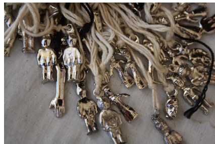
Figuras 1 y 2. Milagritos de cera y metal, asociados a sanaciones