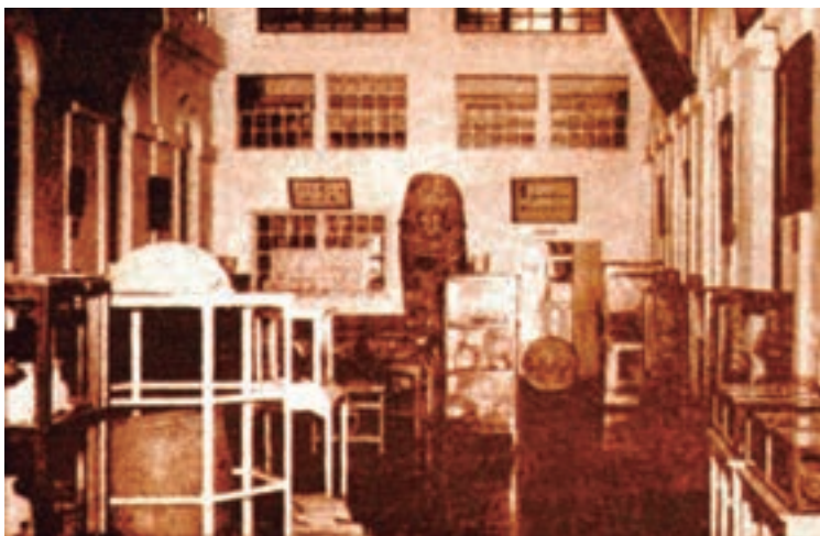
Imagen 1. Aspecto que ofrecía la exhibición permanente del museo nacional cuando se encontraba instalado la Finca Modelo a un costado de la ex Casa Presidencial.

El entorno cultural en el que se desarrolló el Dr. Guzmán pudo ser el germen inspirador para proponer, ante las autoridades estatales del momento, contar con un museo en nuestro país, que se consolidó el 9 de octubre de 1883, coincidiendo con lo que acontecía en Europa debido al surgimiento de muchos museos, promovidos por los cambios sociales que se impulsaron a través de las diversas expresiones artísticas y apertura de muchos espacios museísticos (Batres, 2013).