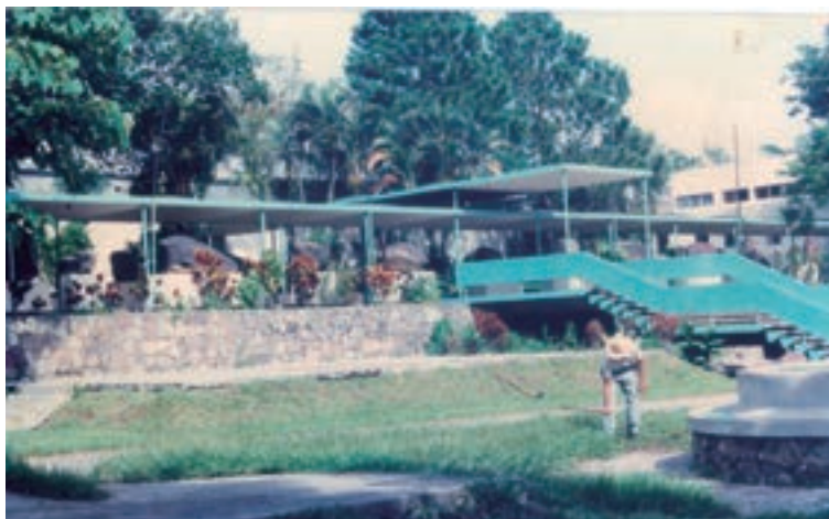
Imagen 3. Fachada principal del antiguo museo nacional ubicado en la avenida La Revolución de la colonia San Benito, en la que se observa el pasillo rupestre.

Este nuevo edificio también soportó las consecuencias del terremoto del 3 de mayo 1965; y durante el tiempo que estuvo habilitado para los servicios públicos también se sucedieron aspectos importantes en el devenir de su funcionamiento, pues a partir de principios de la década de los setenta se propician cambios institucionales, y en 1974 se crea la Administración del Patrimonio Cultural; se construye a su vez el edificio administrativo para el funcionamiento de su estructura técnica y administrativa, donde se ubicaban las siguientes unidades laborales: Departamento de Museos, Departamento de Investigaciones, Departamento de Sitios y Monumentos, además de un área administrativa, constituyéndose así en la columna vertebral de lo que a futuro sería el desarrollo de esta instancia estatal.