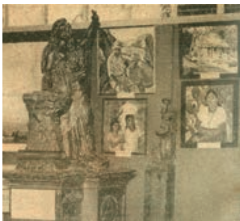
Imagen 4. Muestra de las colecciones que albergaba el museo nacional y que posteriormente se trasladaron durante la especialización temática a otros espacios de exhibición a finales de los años 60.