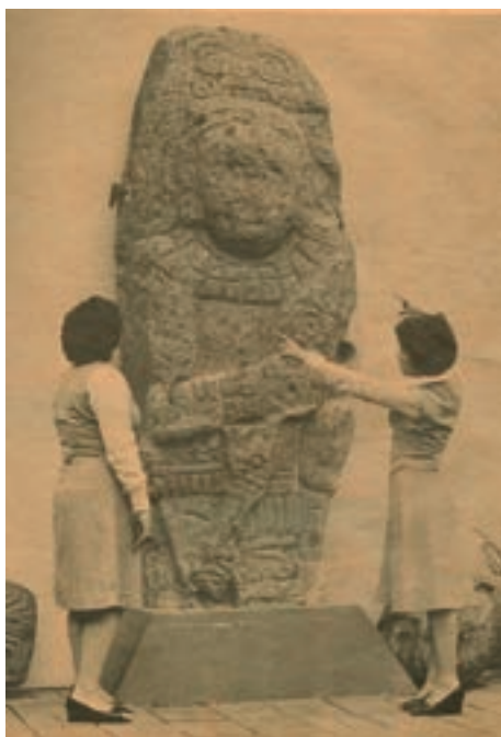
Imagen 7. Dos guías del museo nacional observan la estela de Tazumal en las instalaciones de la primera sede del museo en la colonia San Benito.

Desarrollaba una breve referencia de la cultura durante el periodo clásico a través de la muestra de variados objetos y su diversidad de formas y diseños policromos que