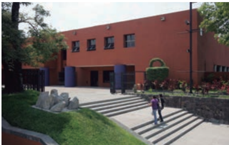
Imagen 9. El actual edificio del Museo Nacional de Antropología.

En las salas, en su nuevo planteamiento museológico y museográfico, la presentación de su discurso respondía a principios fundamentales de continuidad y discontinuidad asociados con la dinámica cultural y sus cambios reflejados en tiempo y espacio, tratando de mostrar las actividades del hombre en su entorno.