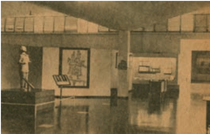
Imagen 6. Sala introductoria del antiguo museo nacional en la avenida La Revolución.

Esta se constituía en el área de ingreso al museo, ubicada en el área vestibular, y sus elementos de exhibición eran la maqueta del relieve topográfico de la República de El Salvador, que ubicaba algunos lugares culturales importantes, entre ellos los sitios arqueológicos, algunas iglesias y vestigios coloniales en nuestro país.