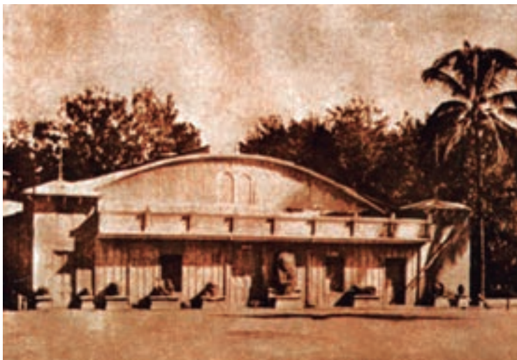
Imagen 2. La estela de Tazumal y algunos petrograbados adornaban la fachada de la Finca Modelo a principios de siglo XX.

Pocas son las referencias acerca de los antecedentes del museo nacional. Su historia se comienza a construir desde el primer espacio que ocupó, mencionándose que fue dentro del antiguo edificio de la Universidad Nacional, posteriormente se ubicó en diferentes espacios, entre ellos los siguientes: