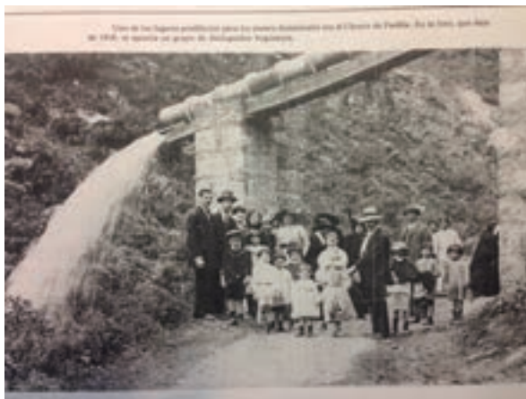
Fotografía 3. Chorro de Padilla.

Por su localización en la parte alta del río San Francisco, en medio de los cerros de Guadalupe y Monserrate y sobre el camino que antiguamente conducía a Choachí, se conoce que en el lugar donde se ubica el Chorro de Padilla existieron los primeros baños de la ciudad. Su nombre se atribuye al descubrimiento hecho por Cenón Padilla en 1864.