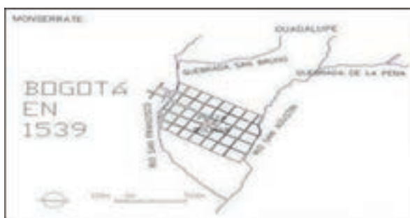
Plano 2. Trazado de la ciudad en 1539.

La plaza mayor (actual plaza de Bolívar) debe su ubicación a los ríos San Francisco y San Agustín, siendo el lugar equidistante y céntrico con respecto a estos dos ejes. “El agua fue determinante en la elección del lugar” (Rodríguez Gómez, 2003:62).