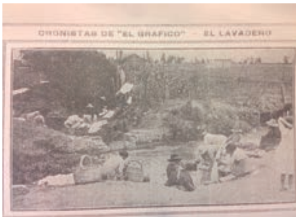
Fotografía 4. “El Lavadero”. Fuente: periódico El Gráfico . Bogotá, 19 de mayo de 1923. Vol. 13 núm. 64, p.704.