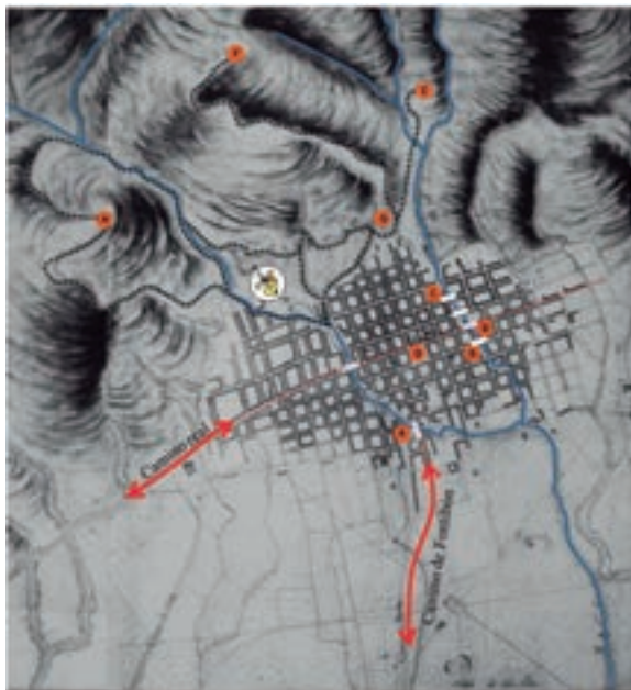
Plano 3. Principales iglesias y parroquias de la ciudad en la rivera de los ríos San Francisco y San Agustín. Base Cartográfica: Esquiaqui Domingo. Plano geométrico de la ciudad de Santa Fe de Bogotá. 1791. Colección particular. Elaboración propia.

En la publicación Calles de Santafé de Bogotá , de Moisés de la Rosa, se afirma que en la antigua ciudad de Santafé existieron 25 puentes sobre los ríos objeto de estudio, 18 sobre el San Francisco y 7 sobre el San Agustín, más otros tantos que se construyeron sobre algunas quebradas como las San Juanito, Guadalupe y Egipto. Puentes hoy todos enterrados a causa de las obras de canalización de estos afluentes. Así mismo, 37 fuentes públicas de las cuales hoy no existe ninguna.