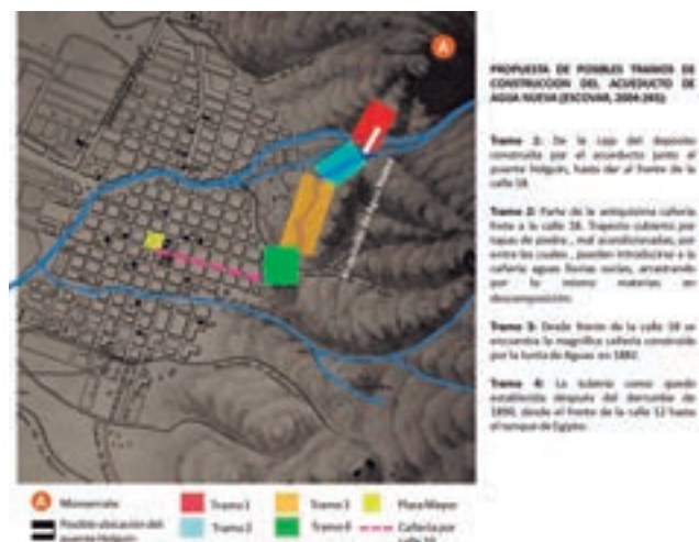
Plano 8. Posibles tramos de la construcción del acueducto de Agua Nueva. Elaboración propia.

Sin embargo, a pesar de la intervención realizada, el acueducto seguía presentando filtraciones que generaban disminución en el suministro e inestabilidad en el terreno, teniendo en cuenta que la cañería se había trazado en paralelo al cuerpo de agua. Fue así como en octubre de 1849 ocurrió un nuevo derrumbe, que fue atendido por el ingeniero Thomas Reed, que se encontraba en el país con motivo de la construcción del Capitolio Nacional. A lo largo de los años la inestabilidad del terreno se seguía viendo afectada, especialmente por la permanente explotación del cerro para la extracción de arena y piedra, por lo que fue necesario hacer una nueva intervención en 1880. A continuación se presenta un plano con las posibles fases de refacción del acueducto.