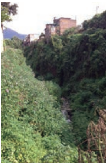
Fotografía 2. Cuerpo de agua detrás de la plaza de mercado Rumichaca, posible río San Agustín.

El río San Francisco nace en el páramo de Choachí en las estribaciones del cerro de Monserrate. Durante el primer tramo de su cauce, antes de llegar a la actual avenida Circunvalar, recibe el caudal de las quebradas de San Bruno y Guadalupe, y aproximadamente a la altura de la Casa Museo Quinta de Bolívar, inicia su canalización.