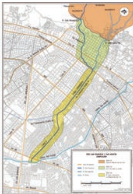
Plano 9. Zonificación de los ríos San Francisco y San Agustín.

Zona 3 (color amarillo). El canal de los Comuneros; la reaparición del río. En esta zona actualmente se adelantan trabajos para la construcción de la troncal de Transmilenio (sistema de transporte masivo de la ciudad). El canal de los Comuneros hoy en día es concebido como un canal por el que fluyen aguas lluvias y aguas residuales de la ciudad y, por supuesto, no existe en el imaginario de las personas ningún punto de conexión entre este y los ríos San Francisco y San Agustín.