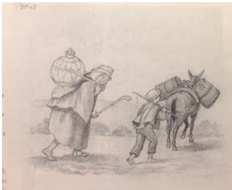
Ilustración 1. Dibujo a lápiz de Ramón Torres Méndez, para su álbum de costumbres neogranadinas. Colección Biblioteca Luisa Ángel Arango. Fuente: Puyo Vasco. 1988:37.

Los viernes, por ejemplo, allí tenía lugar el mercado; y también el tránsito diario debía darse por la necesidad de recoger agua del “Mono de la Pila” para ser transportada hasta las casas, supliendo así la falta de tuberías que condujeran el agua a domicilio. Es por esto que surge quizá uno de los trabajos más significativos de la época: el de las aguateras o aguadoras, llamadas así por ser mujeres que concurrían a las pilas a recoger en múcuras de barro el agua para llevarla a las casas y venderla. En su cotidianidad, ellas se relacionaban con las pilas, chorros de agua y ríos, lugares a los que acudían para recolectar el preciado líquido y en torno a los cuales generaban puntos de encuentro y reunión.