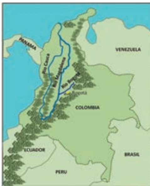
Mapa 1. Ríos San Francisco. y San Agustín.

Los ríos San Francisco y San Agustín pertenecen a la red hidrográfica que nace en los Cerros Orientales y que actualmente hace parte del sistema hídrico que abastece a la ciudad de Bogotá. Los predios en los que se encuentran los nacimientos de estos ríos y de los demás cuerpos de agua que nacen allí se encuentran bajo tutela de la Empresa de Acueducto, Alcantarillado y Aseo de Bogotá (EAB) y su manejo está a cargo de la dirección de abastecimiento de esta entidad. Sin embargo, los Cerros Orientales hacen parte de la Reserva Protectora Bosque Oriental de Bogotá, cuya administración depende de la Corporación Autónoma Regional de Cundinamarca (CAR).