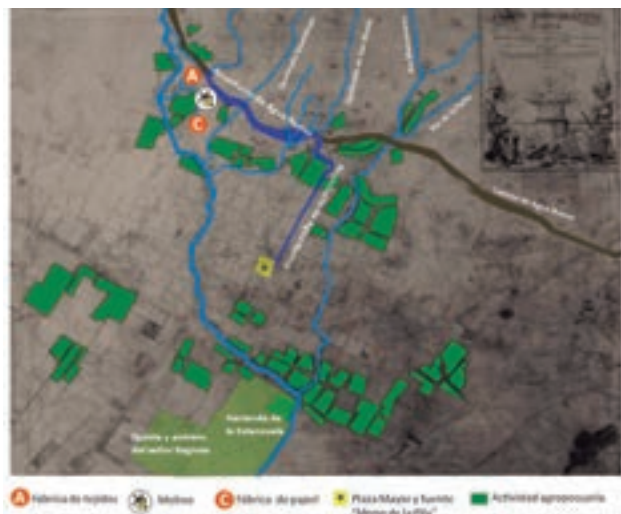
Plano 6. Tierras productivas en las riberas de los ríos San Francisco y San Agustín. Base cartográfica: Codazzi Agustín. Plano Topográfico de Bogotá y sus alrededores (1849). Museo del Chico. 1849. Elaboración: propia.