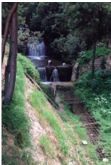
Fotografía 1. Inicio de canalización del río San Francisco, vistas en el recorrido realizado con la fundación Alma y la alcaldía local de la Candelaria.