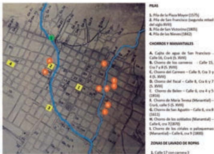
Plano 7. Ubicación de pilas, chorros y manantiales. Fuente: Parga Polania, Julio. Plano de Bogotá. Escuela Topográfica Salesiana. 1905.

Es interesante visualizar cómo la labor de las mujeres en el siglo XIX fue fundamental para mitigar la necesidad de abastecimiento de agua que no se tenía por falta de sistemas de acueductos propicios, y cómo se crea en torno a esto una dinámica colectiva, principalmente femenina, que estuvo directamente relacionada con los ríos San Agustín y San Francisco como abastecedores de las principales pilas de la ciudad. Además del “Mono de la Pila”, la actividad de recolección de agua se realizaba en otras tres pilas: Nieves, San Francisco y San Victorino, las cuales se encontraban ubicadas en lugares estratégicos, abasteciendo a la ciudad entre las actuales carreras 6 y Caracas, entre calles 10 y 22. Pero la ciudad también contaba con una serie de chorros y/o manantiales cercanos a los ríos, destacando el Chorro de Padilla, los cuales se convirtieron para aquel momento en importantes puntos de recolección y suministro de agua, conformando un sistema en conjunto con las fuentes públicas: