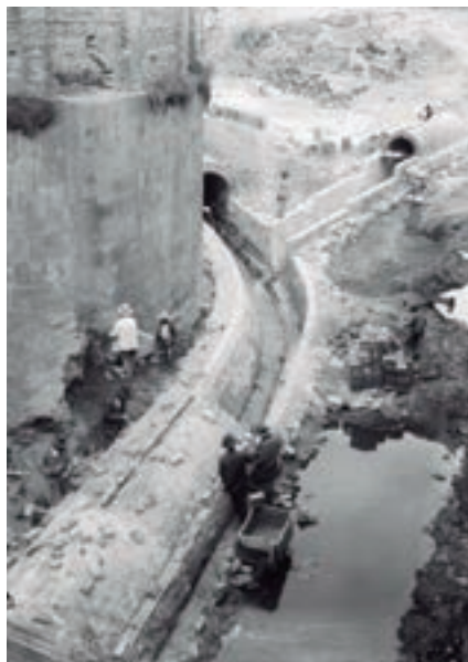
Fotografía 5. Construcción de canales del río San Francisco. Autor: Anónimo. Fuente: Fondo “Luis Alberto Acuña”. Colección Museo de Bogotá. MdB00056. c.a. 1910.

Desde la primera mitad del siglo XX, la existencia de estos ríos empezó a quedar en la memoria olvidada de una ciudad que creció de la mano de estos recursos hídricos, y de los que poco se hablaría en la historia por venir. Como resultado del proceso de modernización de la ciudad, finalmente lo urbano se impuso sobre lo rural, sobre el campo, sobre la naturaleza y finalmente sobre los ríos.