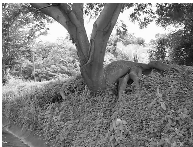
Fig. 4 Tronco y sistemas de raíces deformados del Enterolobium cyclocarpum

Es notorio observar que estas especies ( Delonix regia y Enterolobium cyclocarpum ) con menor dominancia, se encuentran severamente deformadas en su tronco; tal como se refleja en la figura 4.