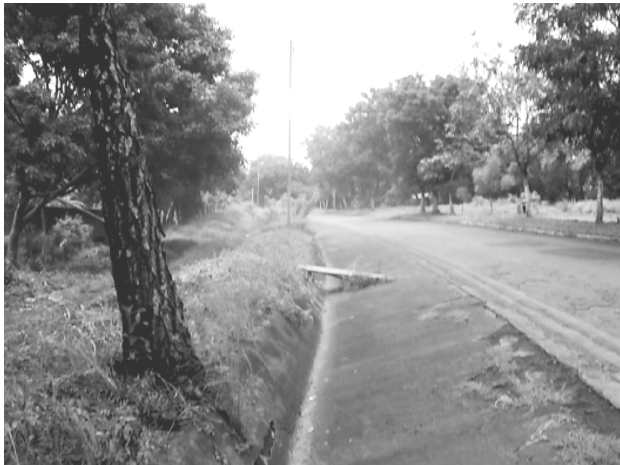
Fig. 2 Adaptación de Tabebuia rosea en estructuras de drenajes en la carretera Las Flores–Diriá, 2007.

En la figura 2 se observa que la Tabebuia rosea presiona la estructura de la cuneta revestida deteriorándola; y a su vez, el sistema radicular de esta planta se ve sometida a deformaciones o alteraciones para aprovechar los nutrientes del suelo.