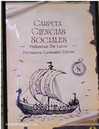
Carpeta de clase del estudiante