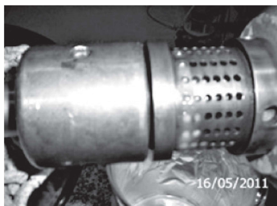
b) Residuo sólido,