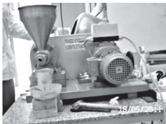
a) Prensa de tornillo