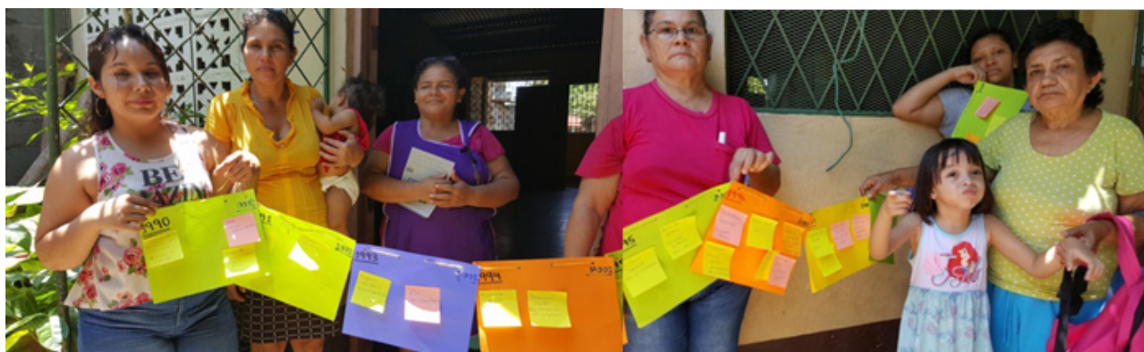
Fotografía N°1 Taller de Líneas de Tiempo Comunitarias, Barrio Hilario Sánchez, 2017. Se detalla el trabajo de memoria entre los años 1990 y 1994.

“(...) para aquel tiempo (1967), lo que es el Hilario Sánchez eran predios sin nada, terrenos de allegados de Somoza, que posteriormente tomaron personas que venían del interior y expandieron poco a poco las viviendas (...) después del terremoto (1972) muchas familias afectadas, fueron ubicadas en esa zona, limi-