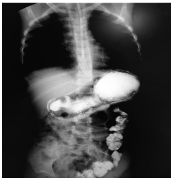
Figura No. 1: Se observa dilatación de la cámara gástrica y retardo de la salida de contraste. El colon descendente con medio de contraste remanente por Serie Esófago-Gastro-Duodenal del día previo a este estudio.