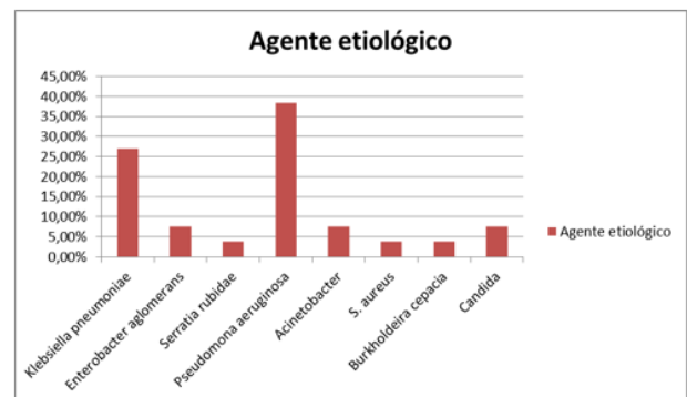
Gráfico No. 2 Pacientes con IAAS de la Sala de Lactantes, según el agente etiológico aislado.

Los agentes etiológicos encontrados fueron las enterobacterias ( Klebsiella pneumoniae , enterobacter agglomerans , serratia rubidae ) en 38.4% de los casos, junto con la pseudomona aeruginosa 38.4%. (Ver gráfico No. 2)