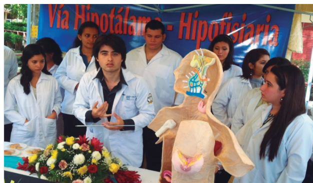
Figura No. 1: Feria Científico Cultural de la EUCS, Primer Semestre 2013

Estudiantes de Ciencias Morfológicas en presentación del tema.