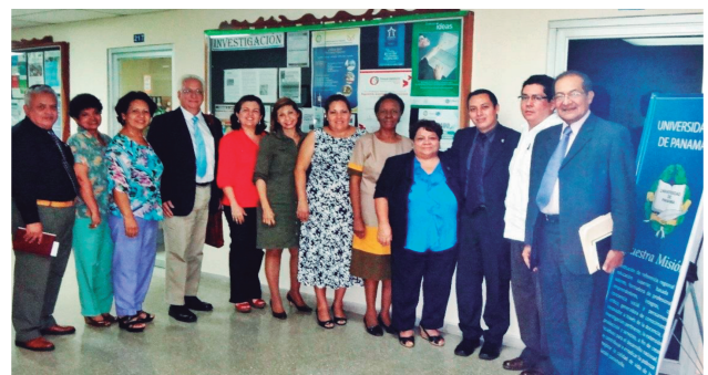
Equipo de Académicos de la EUCS y de la UP.