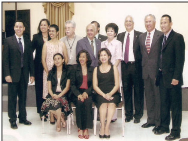
Se encuentran: Miembros de la Comisión de Transición, Representantes de la Facultad de Ciencias Médicas y Planta Docente inicial.

En Agosto del 2006 con el inicio de las ciencias morfológicas la matrícula se realizó con un cupo limitado de únicamente 40 estudiantes de excelencia académica, quienes fueron aperturando cada periodo académico, para el 2011 la carrera ha completado el séptimo año que equivale al internado rotatorio, contando con Médicos en Servicio Social para el año 2012, hasta culminar, juramentarse en ceremonia solemne y graduarse en el 2013 un total de 29 médicos, (Ver Figura No. 2) (7) así han continuado finalizando haciendo un total para el 2015 de 102 médicos graduados. (8)