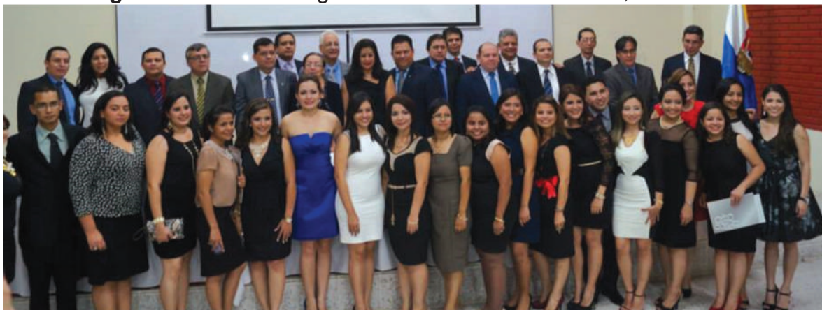
Se encuentran: graduandos acompañados por docentes y autoridades que asistieron al evento, el cual se realizó el viernes 06 de septiembre de 2013.