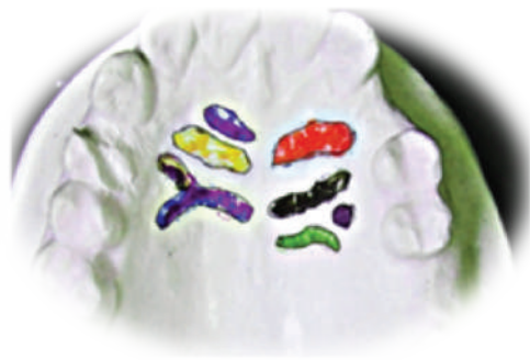
Figura N° 3 Impresión Dental del estudio

El duplicado obtenido se dividió por la línea media y se registraron las formas y números de rugosidades palatinas de cada lado.