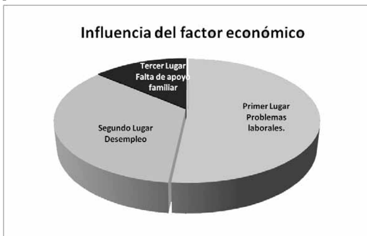
Gráfico No. 1. Influencia del factor social en la deserción

En primer orden se encontraron los problemas laborales, seguidos del desempleo y la falta de apoyo familiar, como se podrá apreciar en el gráfico el peso que le corresponde a cada uno.