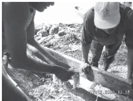
Foto 2: Hombre en labores de la Pesca en la comunidad de Rama Cay.