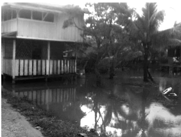
Figura No. 3. Imágenes de construcciones de casas.

La vegetación tiene una fuerte influencia en el régimen hidrológico de la cuenca de Bilwi Tingni, pues este recurso está relacionado con la erosión, temperatura y evaporación de la zona. La degradación de este valioso recurso incide fuertemente en el desequilibrio del resto de los componentes tanto bióticos como abióticos, dando lugar a fenómenos como emigración de la fauna silvestre, inundaciones y por ende surgimiento de epidemias entre otras. De igual manera a profundidades mayores de un metro aún se encuentran desechos sólidos inorgánicos persistentes como botellas de vidrio, latas de aluminio, latas de pintura, embases plásticos, llantas y suelas de zapatos, producto de acumulaciones periódicos.