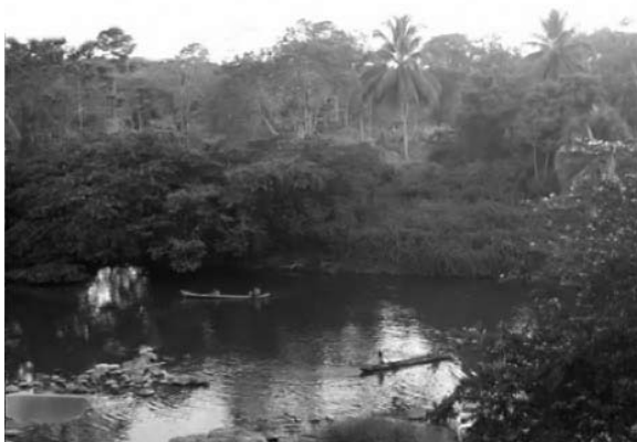
Figura No. 1. Vista del río Wawa-Moss.