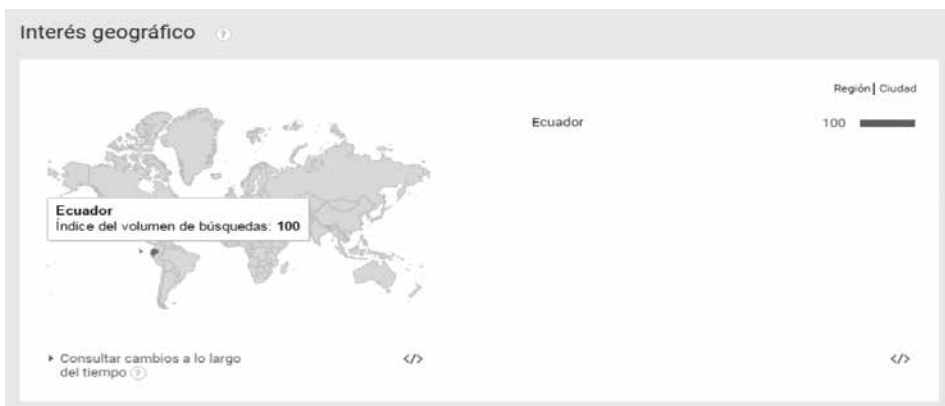
Figura 2: Interés Geográfico

en base al número de búsquedas) concentrados geográficamente en el Ecuador, lo cual dejó ver la necesidad de ampliar los horizontes de difusión y reforzarlos.