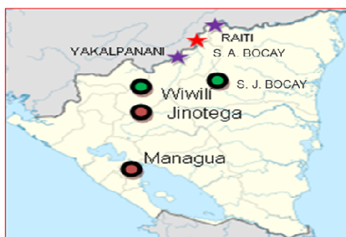
Imagen 1: Ubicación en el mapa de Nicaragua la comunidad Indígena de San Andrés de Bocay.

Técnicas e instrumentos: Se revisaron documentos, visitas y recorridos por la comunidad, entrevistas a dirigentes, dos grupos focales y encuesta. La participación de los ciudadanos fue voluntaria y se realizó una pregunta central: ¿Principales estrategias de supervivencias, socioeconómicas empleadas en las últimas dos décadas por los comunitarios indígenas? La información brindada fue analizada, ordenada, procesada en programas de office de forma adecuada y ubicada en el desarrollo de los resultados.