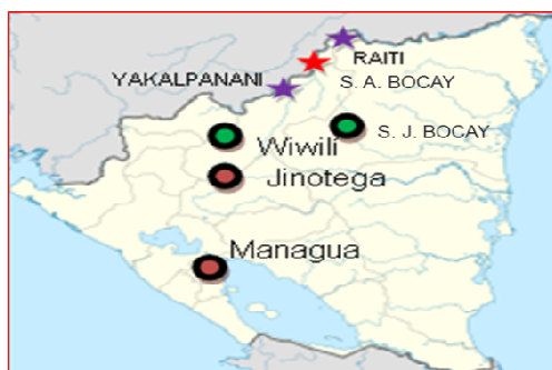
Imagen 1: Ubicación en el mapa de Nicaragua la comunidad Indígena de San Andrés de Bocay.