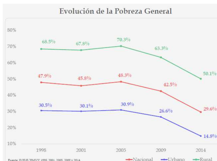
Ilustración 3.

significativa de la pobreza general de 42.5% a 29.6% y de la pobreza extrema de 14.3% a 8.3% (INIDE, 2015). Sin embargo, la pobreza