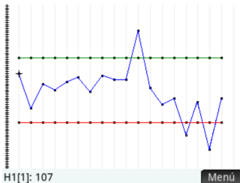
FIGURA 5. Límites de variación del recobrado de clorpirifos en mani.

Con la tecla Plot se obtiene la gráfica de la figura 5. Donde se observan claramente los puntos “outliers” y los límites de variación de los valores de recobrado de clorpirifos en mani