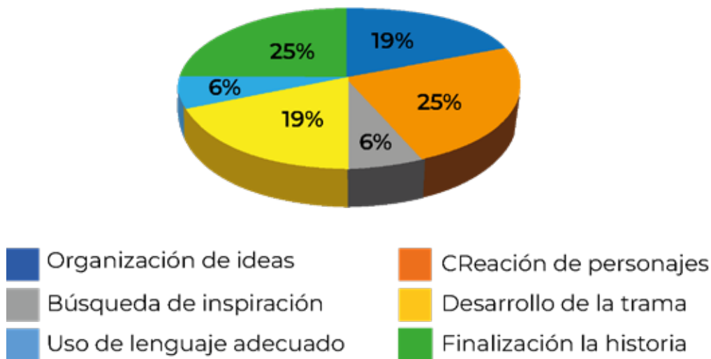
Figura 4 Dificultades en la prueba diagnóstica

Nota. La figura 4 muestra las dificultades que afirmaron tener los estudiantes al realizar la prueba diagnóstica.