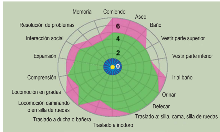
Figura 1. Escala de Independencia Funcional. Extraído de Crothed Mountain Speciality Hospital.16 Esta ilustración muestra las puntuaciones posibles para la funcionalidad en la admisión (azul), después de ocho semanas de rehabilitación (verde) y en el alta (rosa).

la funcionalidad (Figura 2 y Cuadro 1), se egresó de sala de rehabilitación y continúa con terapia física ambulatoria, sumado a esto recibió terapia psicológica y abordaje por otorrinolaringología y cirugía plástica para tratar secuelas de traqueotomía.