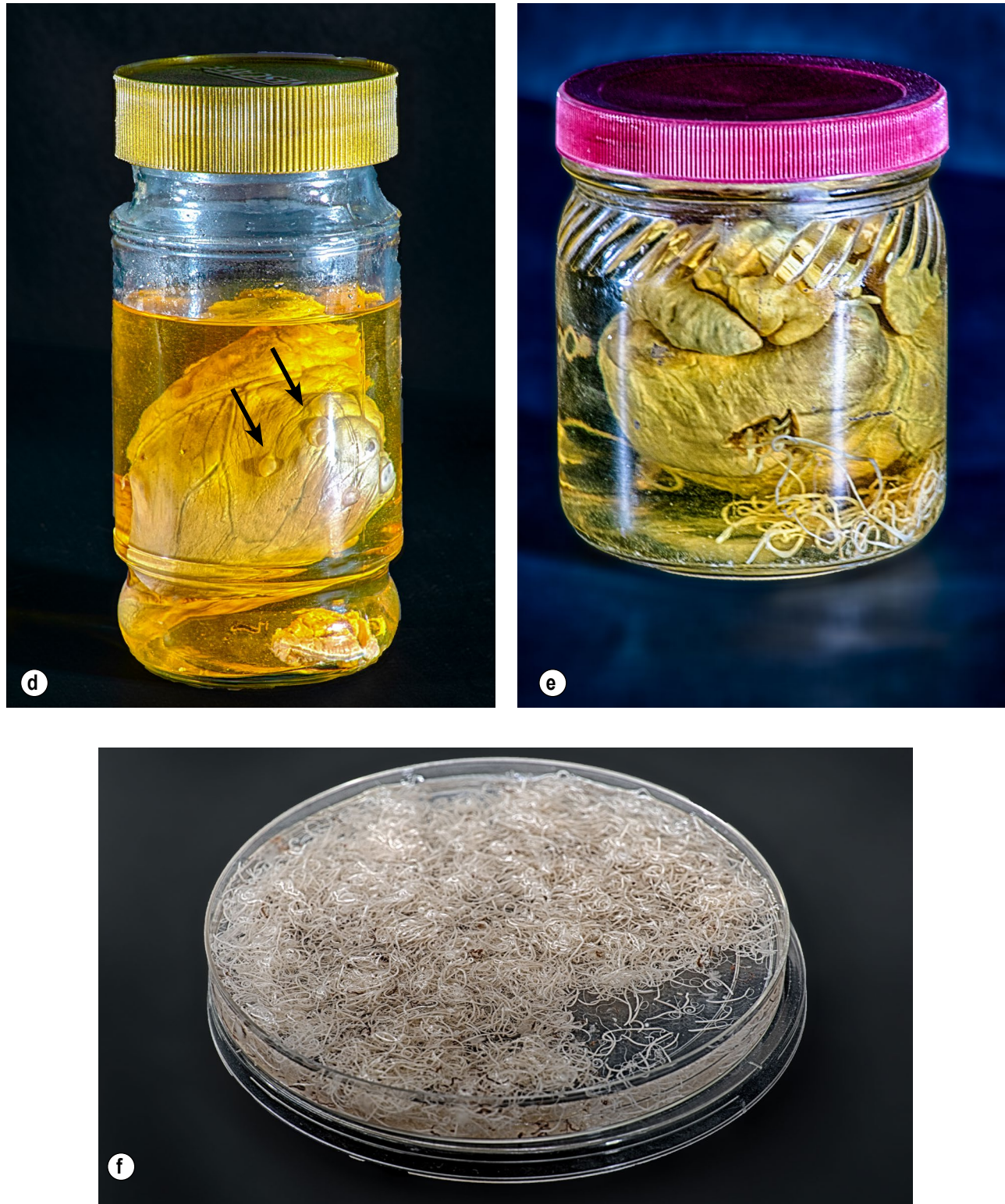
Figura 2. Cont. d) Cisticercos de Taenia solium en corazón de cerdo (flechas); e) Dirofilaria immitis gusanos adultos en corazón de perro; f) Trichuris trichiura , un estimado de 10,000 gusanos adultos recobrados post tratamiento de un niño de 10 años.