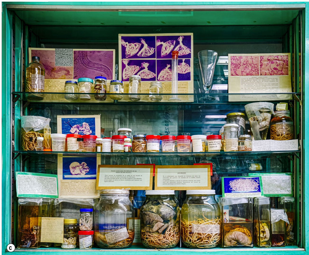
Figura 2. a) Ascaris lumbricoides , piezas patológicas obsequiadas por el Departamento de Patología, Hospital Escuela, y gusanos adultos lavados de las heces post tratamiento de pacientes infectados; b) A. lumbricoides gusano adulto obstruyendo parcialmente un apéndice; c) A. lumbricoides , numerosas muestras de gusanos adultos en piezas anatómicas y solos recobrados de diferentes pacientes, fotografías que ilustran la persistencia local de esta parasitosis: