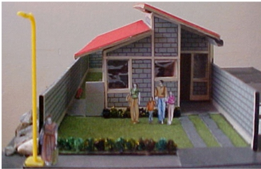
Maqueta alusiva a la vivienda social

Docente de la Facultad de Ingeniería de la Universidad Nacional Autónoma de Honduras, graduado de la II Promoción del Doctorado en Ciencias Sociales con Orientación en Gestión del Desarrollo.