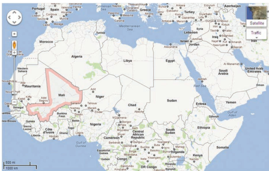
Mapa 1 Localización de Mali en África