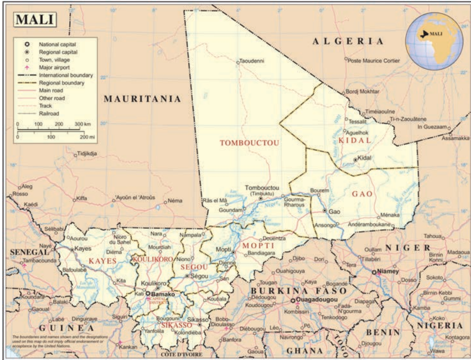
Mapa 2 Mapa político e hidrográfico de Mali