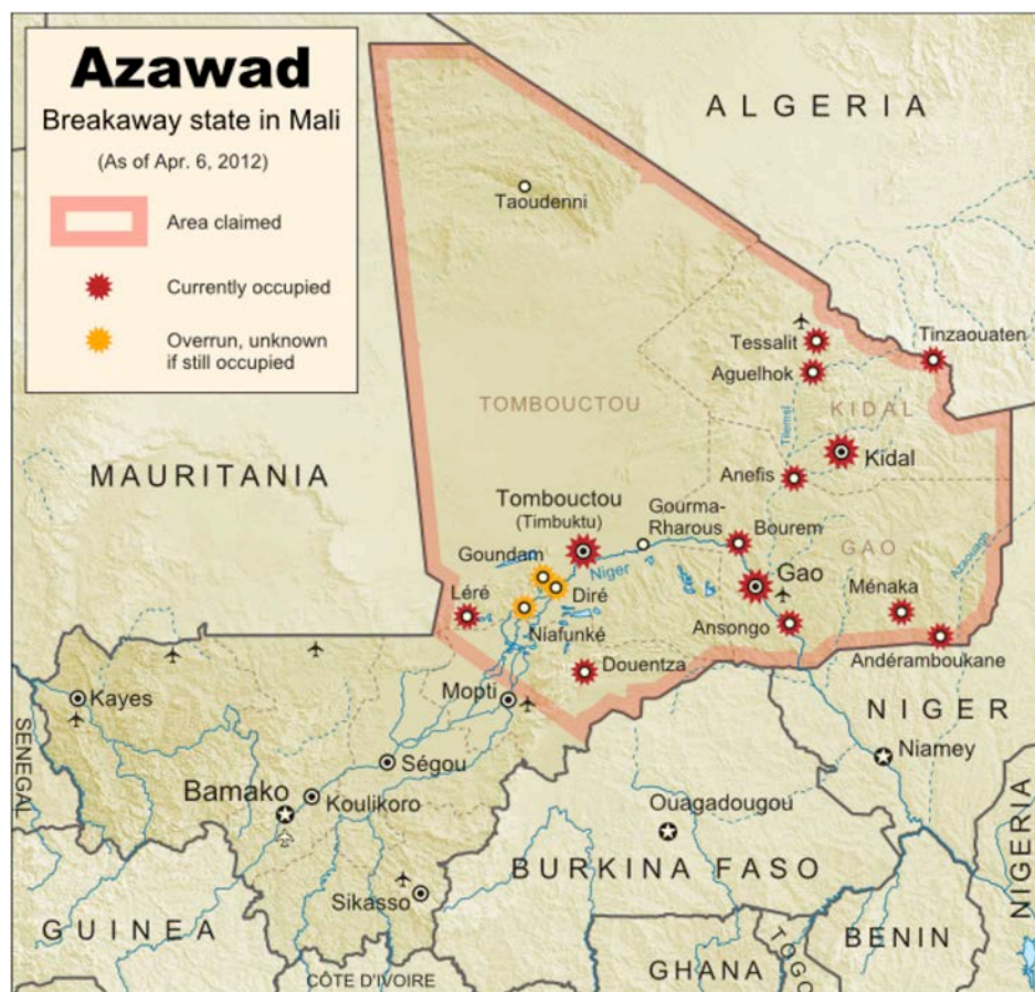
Mapa 3 Control de las principales ciudades del norte de Mali por el MNLA el 6 de abril, el día de la declaración unilateral de independencia del Azawad

des no tuvieron dificultad en conquistar las principales ciudades del norte en tres días, Kidal, Tombuctú y Gao (30 y 31 de marzo y 1 de abril respectivamente). Nunca antes habían podido expulsar al Estado maliense con tanta contundencia y rapidez. El MNLA proclamó la independencia unilateral del Azawad el 6 de abril de 2012 mientras que el fragmentado y pobremente armado ejército de Mali anunciaba una “retirada estratégica 24 ”.