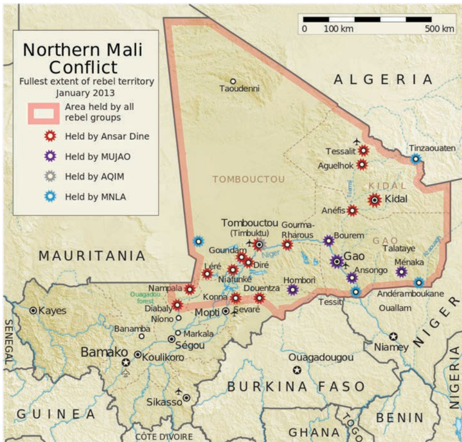
Mapa 4 Control de las principales ciudades del norte de Mali por los diferentes grupos armados, enero de 2013

tante peso en la conquista. La organización pasó a controlar la ciudad y región de Tombuctú, junto con Ansar Din. Ansar Din, liderado por el tuareg del clan de los Ifoghas Ag Ghali, y con muchos componentes de ese clan entre sus filas, dominó Kidal en una clara señal de erigirse como el líder tuareg por excelencia después de que se le denegase liderar la rebelión del MNLA contra el Estado maliense. En estos territorios los grupos intentaron implantar un Estado islámico a través de la imposición de la sharía y consolidar así un refugio desde donde realizar sus actividades clandestinas y terroristas en la región del Sahel.