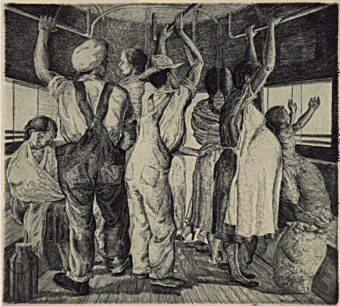
Miguel Ángel Ruiz Matute. 1951. Sin título. Aguafuerte. 23 x 20 cm. Una de las obras más tempranas del artista, de hecho está firmada únicamente Ruiz hacia la esquina inferior derecha, lo que en años posteriores cambiaría para firmar sus obras Matute en su característica letra que mantuvo hasta el final de su carrera.

en formato digital 35mm. 2018.